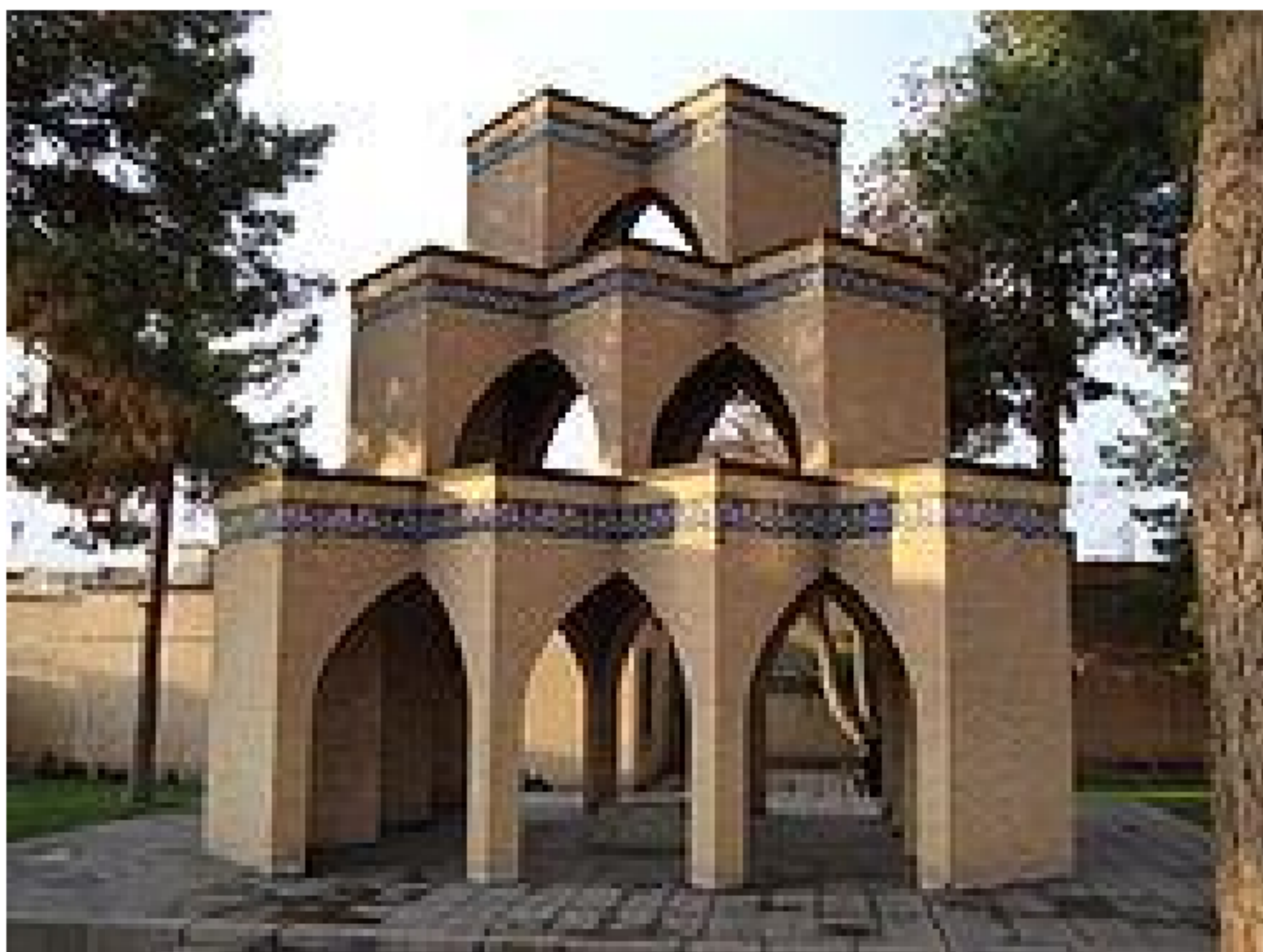
Сабзаворда Ҳусайн Воиз Кошифий шарафига ўрнатилган ёдгорлик