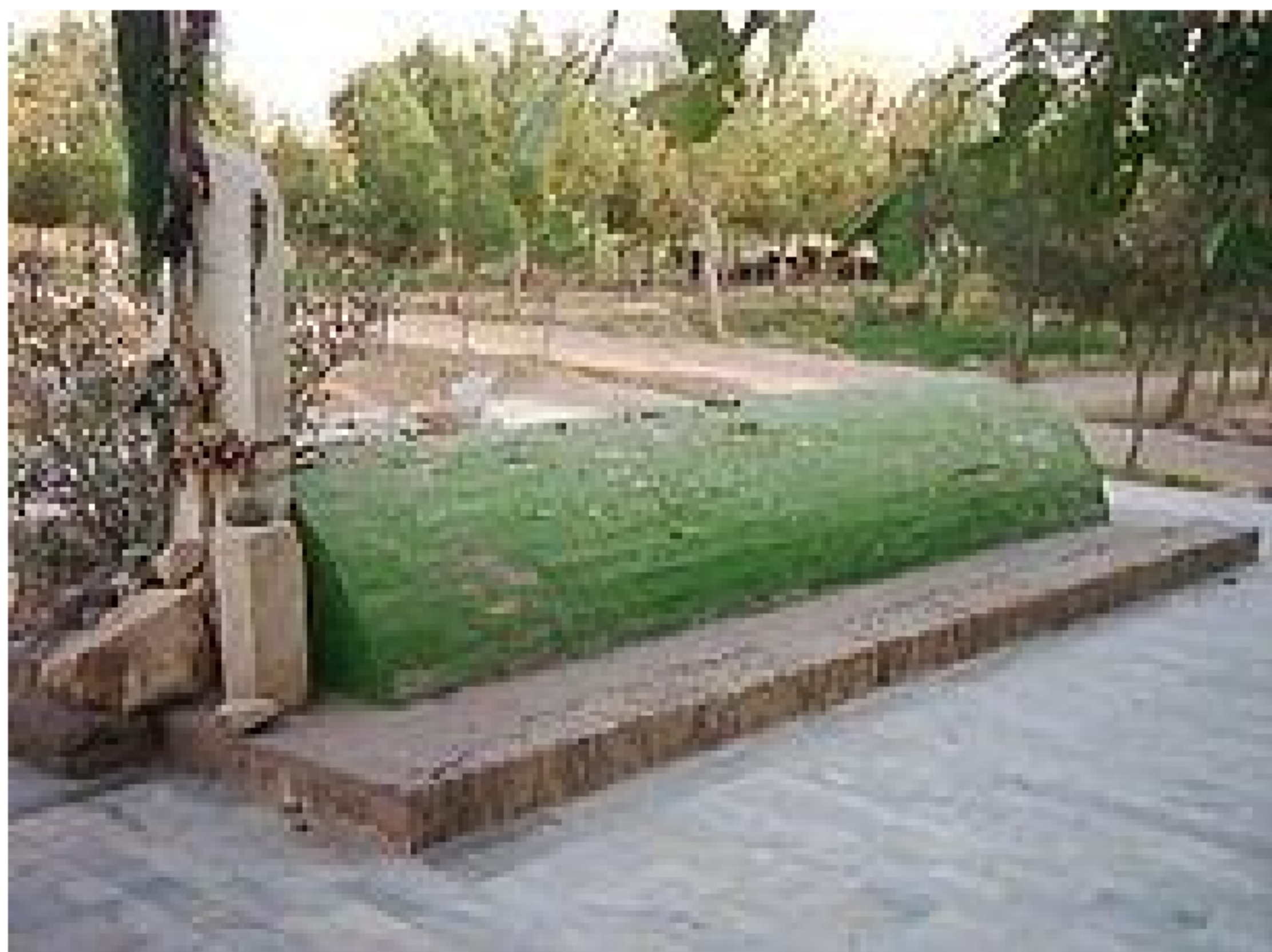
Ҳирот. Мавлоно Ҳусайн Воиз Кошифий қабри.